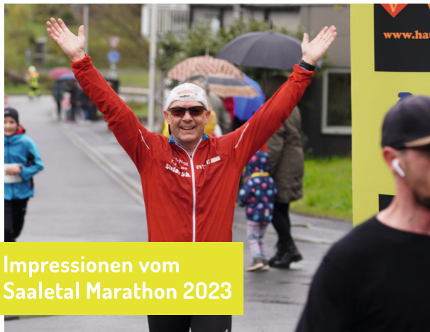
Impressionen vom Saaletal Marathon 2023

Wir danken unseren Sponsoren für die Unterstützung im Jahr 2023.