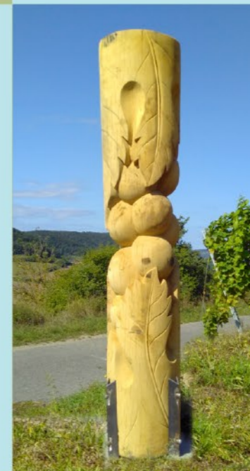
Traubensäule Herbert Holzheimer

Blümli ist eine ca. 2,5 m große Holzskulptur aus duftendem Zirbelkiefernholz. Wie der Name schon sagt ist Blümli eine Blüte. Sie sieht aus wie ein Enzian mit fünf Blütenblättern und Blütenstempeln. Eben ein kleines Blümli, aber als Skulptur steht sie da, ganz groß und mächtig.