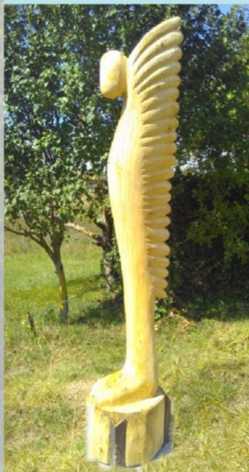
Ikarus Klaus Schneider www.atelier-klausschneider.de

Als Schutzpatron der Weinberge und des Weines hat die Skulptur des Heiligen Urbanus ihren Platz dort erhalten, wo der Wiesenweg auf den untersten Weinbergsweg mündet. Der Heilige Urbanus schützt die Weinberge gegen alle Unwetter wie späten Frost, Hagel und Blitzschläge und sorgt dafür, dass die viele Arbeit der Winzer im Herbst Früchte trägt und sie alljährlich Weine in höchster Qualität erzeugen.