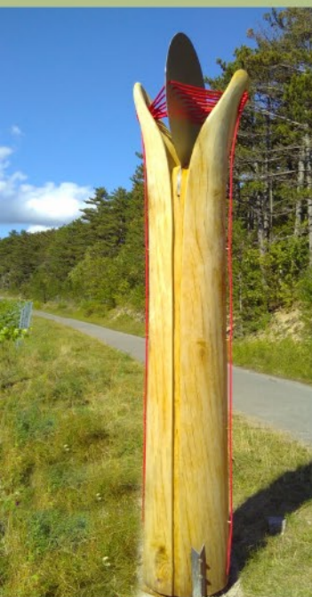
Inklusion Günter Nöleke

Die Idee ist, die Inklusion unserer Gesellschaft aufzuzeigen, die in der Realität keine ist. Immer gibt es Mitmenschen, die versuchen sich über andere zu erheben. Sowohl die Anordnung, als auch die Größe der Kugeln sollen das verdeutlichen. Die Edelstahlsteller und das Gitterwerk unterhalb der Kugeln versinnbildlichen unser aller Ursprung. Wir sind alle gleich, im Entstehen aber auch am Ende unseres Daseins.