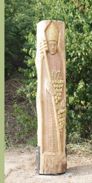
Heiliger Urbanus Margit Unterthiner

Die schlanke, ca. 3 m hohe Stahlskulptur bildet eine geschlossene Form. Zwischen dem unteren und dem oberen Teil befindet sich, als verbindendes Element, ein „Netz“ bestehend aus 250 m Rundstahl. Durch eine spannende Anordnung der formbildenden Kanten entsteht für das Auge des Betrachters der Eindruck, die Skulptur sei aus dem Lot geraten. Nur von einem Blickpunkt aus ist erkennbar, dass sie völlig gerade steht.