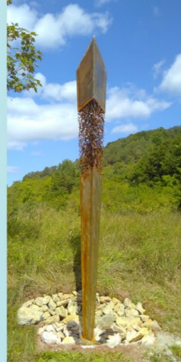
Vernetzung Günter Nöleke

Im Zusammenhang mit der Gründung des Klosters Aura im Jahre 1108 durch Bischof Otto von Bamberg sind die ersten Aufzeichnungen zum Weinort Ramsthal zu finden. Die Skulptur des Bischofs markiert deshalb den Beginn des Ramsthaler Kunstweges innerhalb der Ortschaft. Wer Wissenswertes zur Ortsgeschichte erforschen möchte, kann über mehrere QR-Codes, die an der Skulptur angebracht sind, direkt auf verschiedene Internetseiten gelangen und sich über Themen rund um Ramsthal informieren.